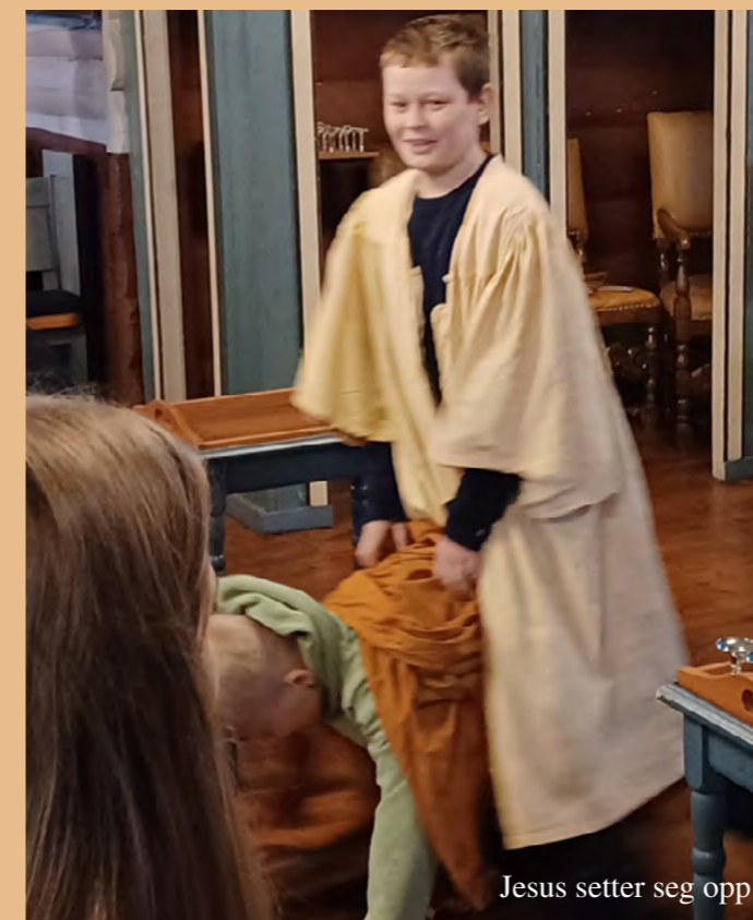
Jesus setter seg opp