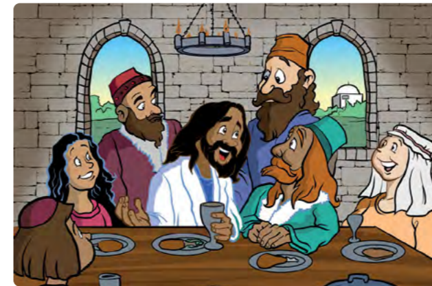
Tegning: Trevor Keen

Disse to bildene er nesten helt like. Klarer du å finne 5 feil på det ene bildet?