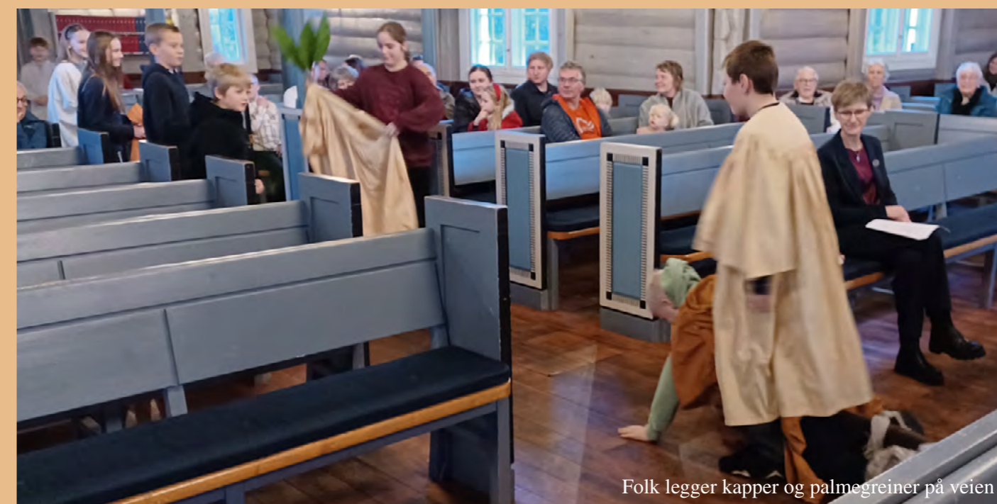
Folk legger kapper og palmegreiner på veien