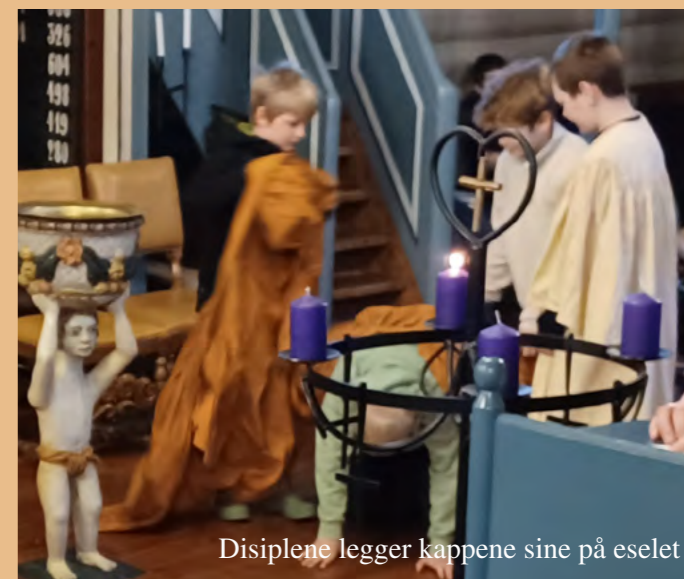
Disiplene legger kappene sine på eselet