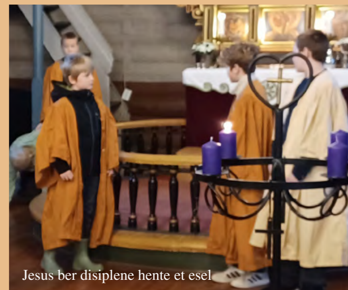
Jesus ber disiplene hente et esel

Det er stas når 11 åringene har vært med på «Lys våken» i kirken. Da har de alltid noe fint å vise oss på gudstjenesten etterpå. Søndagens tekst 1. søndagen i advent, handlet snodig nok om palmesøndag, og vi fikk dramatisert hele historien. Fra Jesus ba disiplene hente et esel, til han red inn i Jerusalem. Takk skal dere ha.