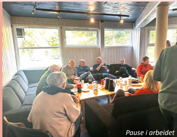
Pause i arbeidet