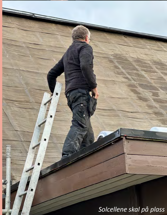
Solcellene skal på plass