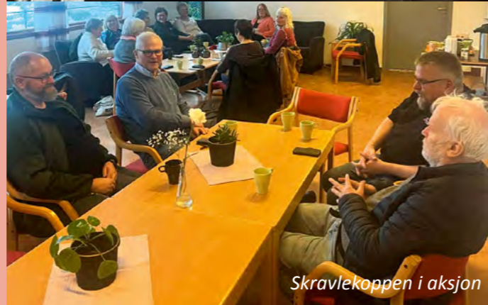
Skravlekoppen i aksjon